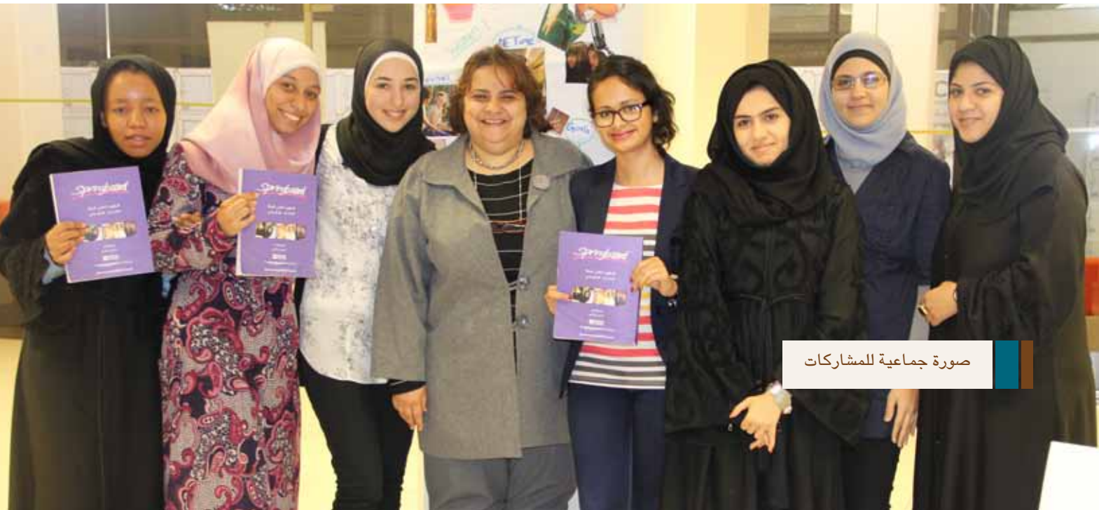
صورة جماعية للمشاركات

ويعد برنامج «سبرنج بورد» من أكثر البرامج العالمية الرائدة في تطوير الذات والمخصصة للسيدات، حيث أظهرت الأبحاث بأنه في برامج التطوير الشخصي، تحقق السيدات نجاحاً أكبر في بيئة داعمة من الإناث فقط. ويلائم البرنامج المرأة العاملة وغير العاملة التي تسعى لتحقيق المزيد في حياتها. كما يزودها بالأدوات اللازمة لتتشرع بالثقة، حيث يعمل البرنامج على مساعدة المرأة على تحديد أهدافها وتحقيق آمالها، وذلك بغية