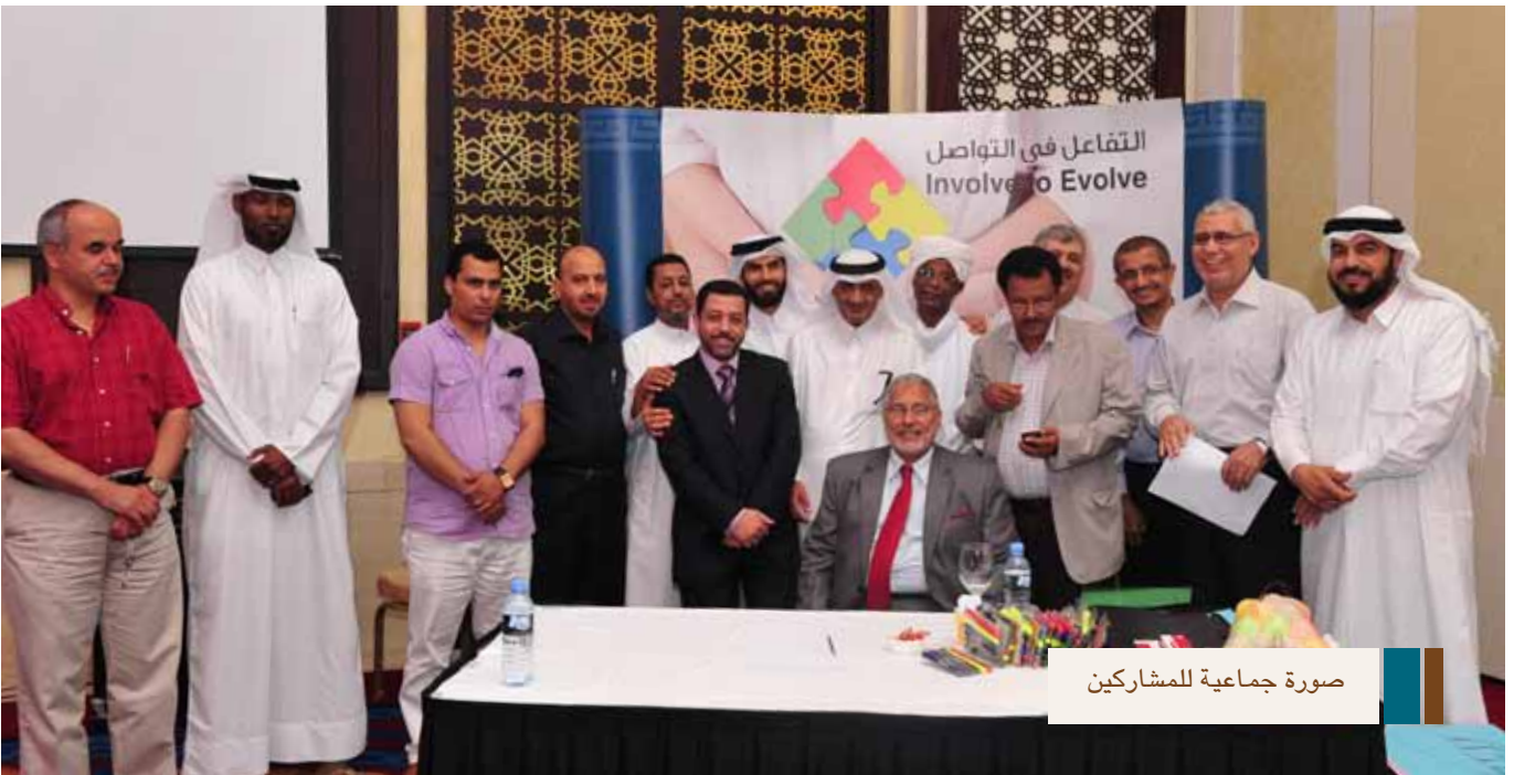
صورة جماعية للمشاركين

وقد أكد الأستاذ الحرمي على أهمية منح الآبناء فرصة للتعبير عن رغباتهم واختيار تخصصاتهم في مجال الدراسة والعمل، والتي تجعلهم مسؤولين عن أقوالهم وأفعالهم، واتخاذ قراراتهم وإن استدعى الأمر من الأهل التدخل فليكونوا ناصحين وموجهين ومرشدين. موضحاً أن التعرف على مشاكل الآبناء في وقت مبكر أفضل لان حلولها تكون بسيطة وسهلة