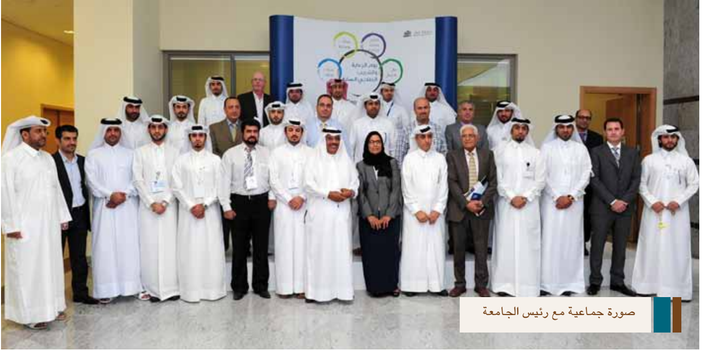
صورة جماعية مع رئيس الجامعة

في إحدى هذه المؤسسات. كما أكد أن اليوم يفتح المجال للطلاب لتحقيق القدرة والتميز في اختيار ما يناسب مجال العمل، كما يتيح لنا فرصة التعريف بأنفسنا وتقديم السيرة الذاتية ويعلمنا كيف يقدم الطالب نفسه لجهات العمل. من جهة أخرى أشاد ممثلو الشركات المشاركة في يوم الرعاية والتدريب الطلابي بهذه الفعالية لأهميتها في تحقيق التواصل الفعال مع الطلبة بشكل عام، وأجمعوا على ضرورة تفعيل فرص التدريب الصيفي والرعاية أثناء الدراسة.