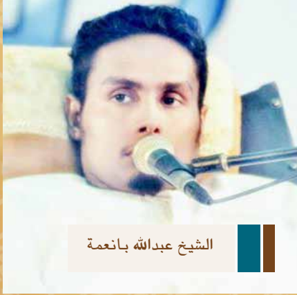
الشيخ عبدالله بانعمة

نظمت إدارة الأنشطة الطلابية بالتعاون مع قسم الارشاد والدعوة بوزارة الاوقاف والشؤون الاسلامية محاضرة للشيخ والداعية المقعد عبد الله بانعمة تحت شعار « هذه قصتي »، وذلك في شهر اكتوبر ٢٠١٢، في مباني الأنشطة الطلابية بنين وبنات.