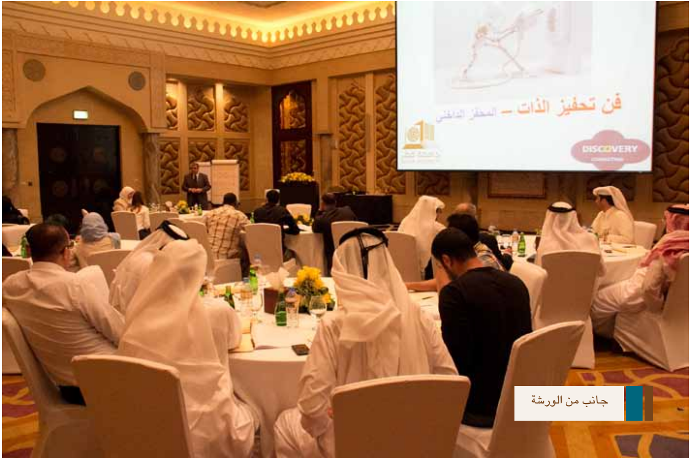
جانبا من الورشة

حيث اختيار الوقت والمكان المناسبين لمعظم الموظفين، وكذلك فكرة تقسيم المشاركين إلى مجموعات في أكثر من يوم كانت مريحة بحيث أمكن للموظفين اختيار الوقت الذي يناسبهم بالتناوب مع زملاء العمل. من الجدير بالذكر أن مهمة قطاع شؤون الطلاب هي صنع بيئة تتمركز حول الطالب نفسه، وذلك من خلال تقديم فرص مبتكرة، وبرامج ذات