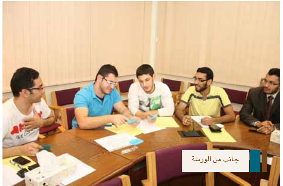
جانب من الورشة

وشملت الورشة شروط تحديد الهدف ومن ضمنها المرونة ، وضرورة أن يكون الهدف في حدود الامكانيات، إلى جانب التخلص من عقدة السمعة، والرغبة في الانتصار إذ قد تأثر هذه